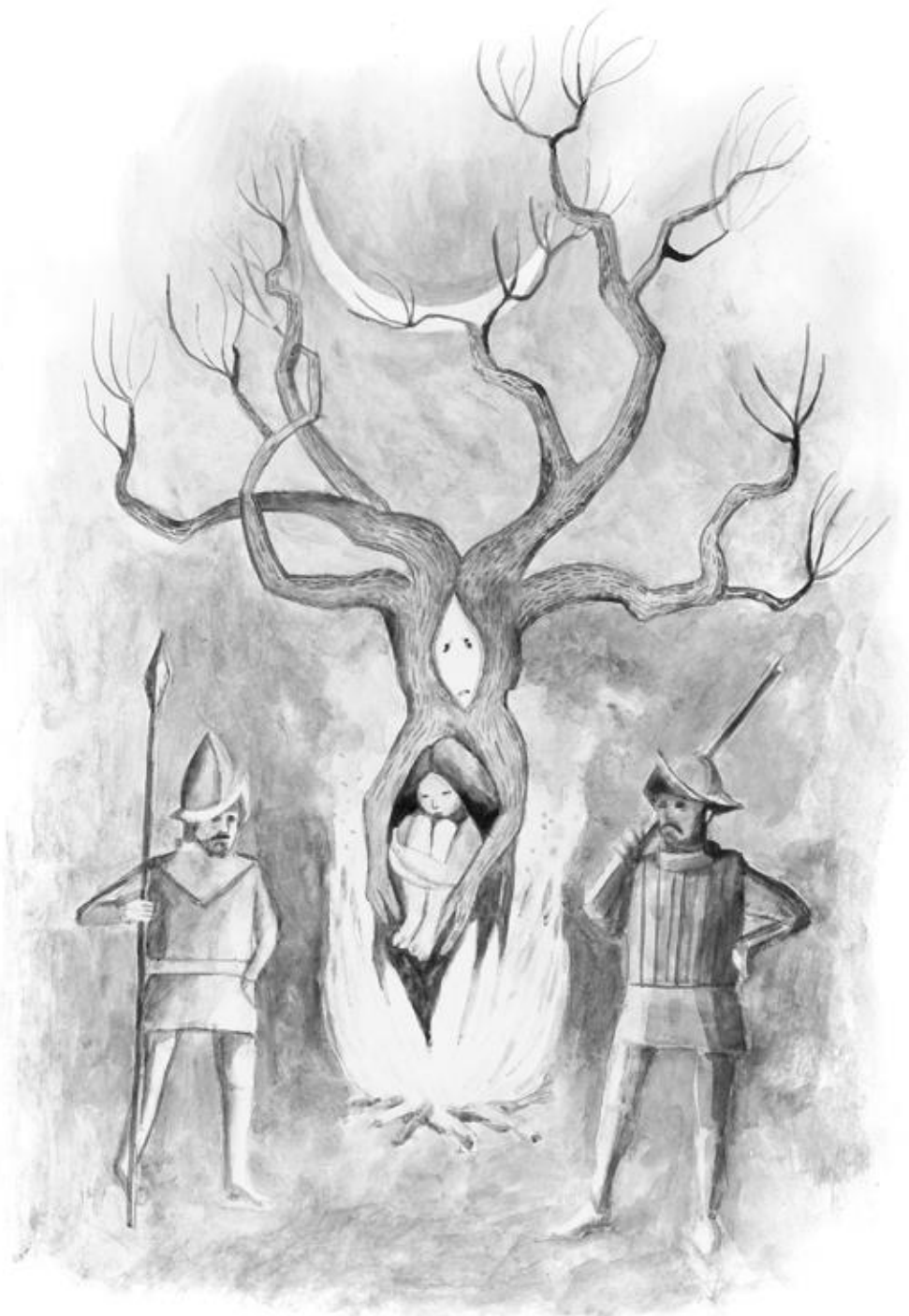
Los españoles ataron a Anahí a un árbol y prendieron fuego, pero el fuego no quemaba